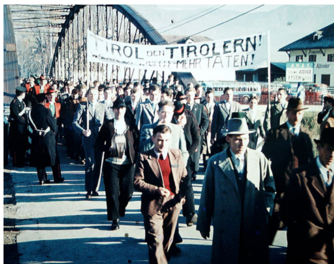
Çalakiya ji bo azadiya Tîrola Başûr a 1957'an de /Bas.tirol

Serokê T. Başûr ji aliyê konseyê ve tê hilbijartin û ji bo herêmê xwedî roleke girîng e. Ew berpîrsê meşandina qanûnên konseyê ne û di heman demê de beşdarê civînên hikumeta îtalyan ên di derbarê T. Başûr de dibe.