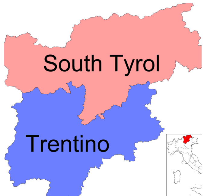
Tîrola Başûr tevli Trentînoyê herêmekê Îtalyayê pêk tîne.

Digel binavkirina dewletê wekî dewleteke 'herêmîparêz', sîstema polîtîk a îtalyan incax di 1970'an de 15 herêmên xweser ên xwedî hin hêzan damezrandiye. Lê ji bo tîroliyên başûr hêzên heyî tê nekiriye û wan ji bo xweseriyê xurtir li hember Romayê têkoşîneke berfireh meşandine. Ji ber bêaramiya li herêmê, Awistîrya meseleya herêmê bîriye Neteweyên Yekbûyî û di 1969'an de bi alîkariya vî rêxistinê di navbera her du dewletan