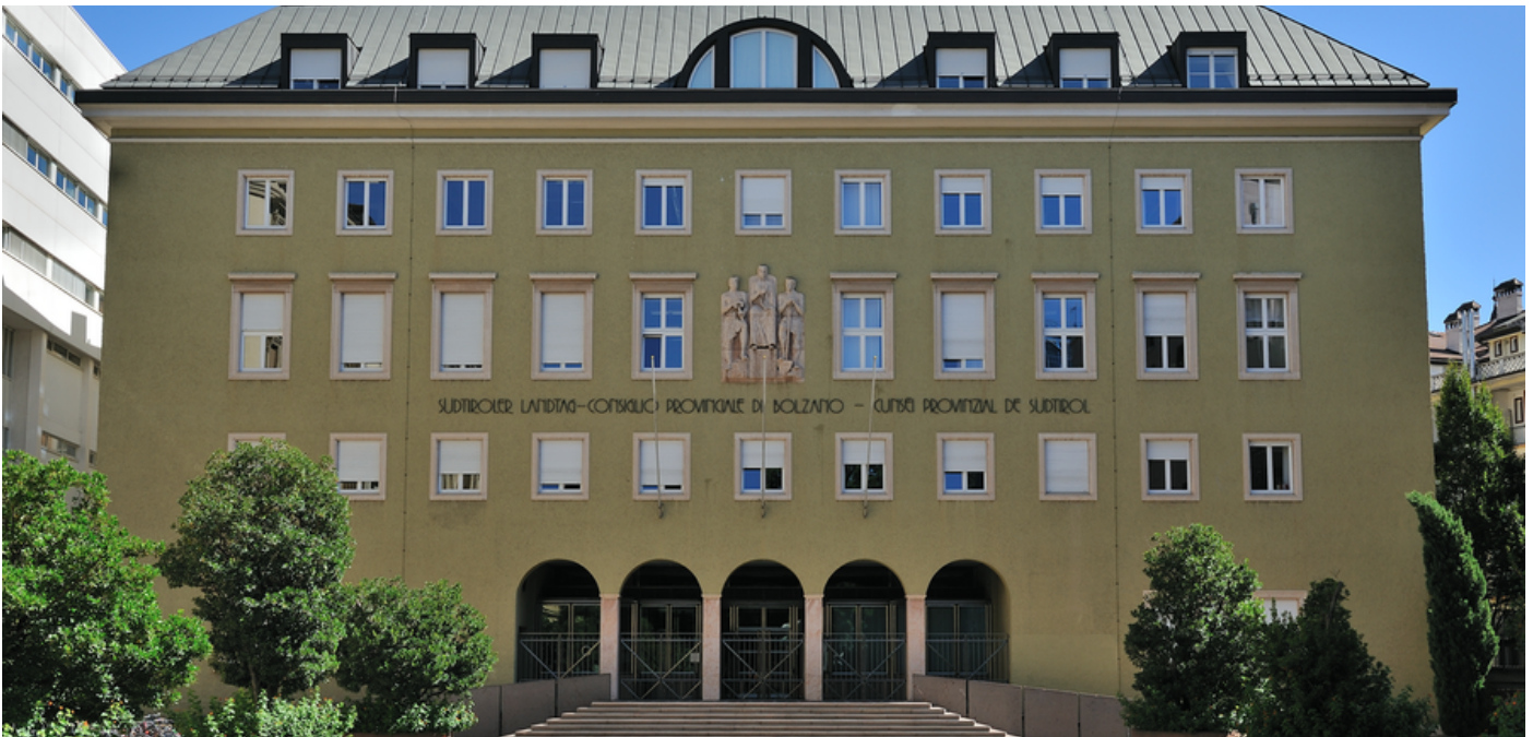
Parlamentoya Tîrola Başûr