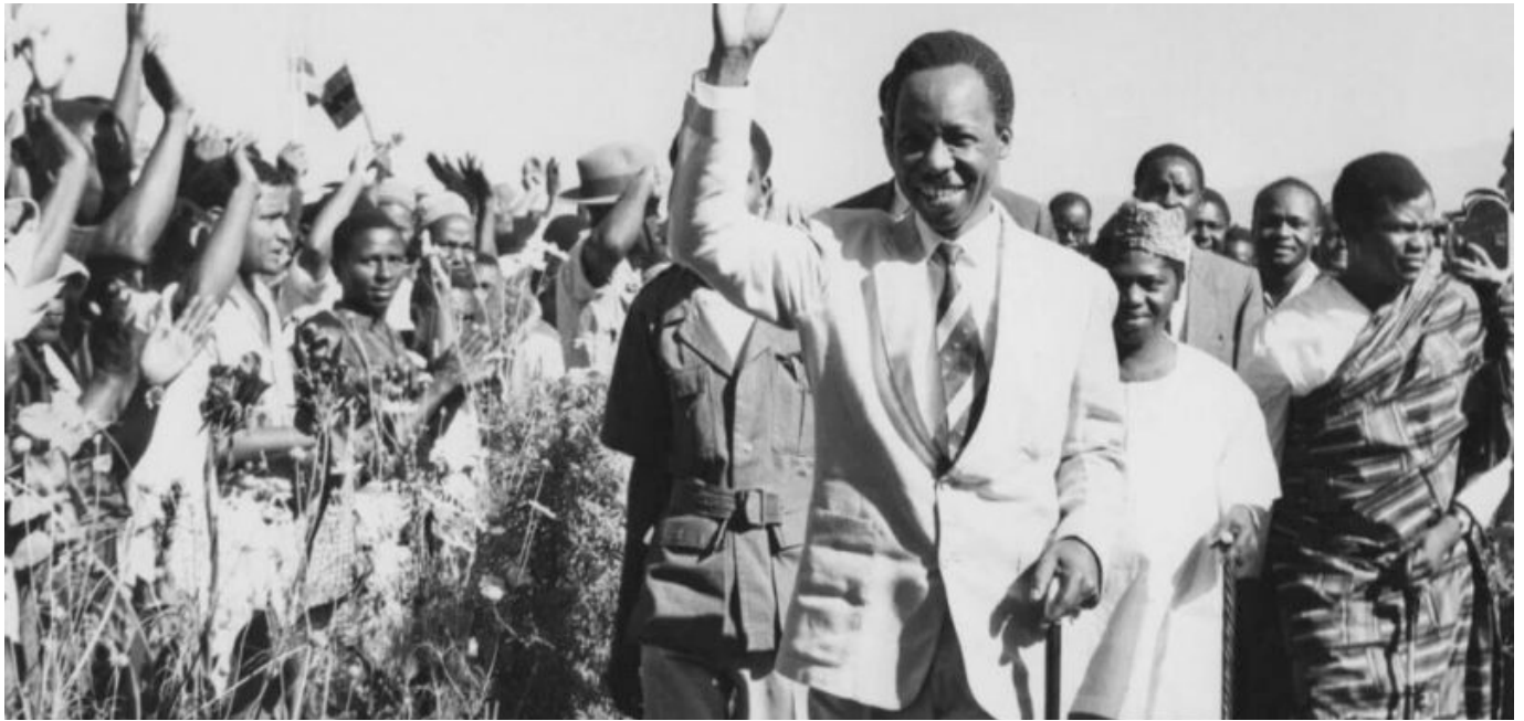
Serxwebûna Tanganyikayê ji aliyê Julius K. Nyerere ve hat ragihandin.

Tanganyika ku welatekî li rojhilatê Afrîkayê ye, di 1961an de bû welatekî serbixwe. Berî vê demê, welêt koloniyeye Împaratoriya Brîtanyayê bû.