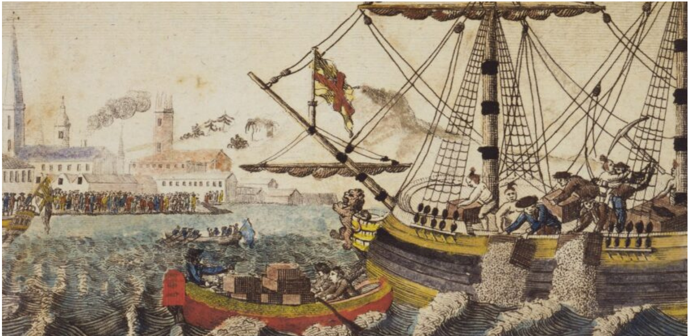
Partiya Çayê ya Bostonê. Berhema W. D. Cooper's ya di The History of North America, London: E. Newberry, 1789

Çirûska ewil a şerê rizgariya Amerîkayê bi bûyereke di 16ê kanûna 1773an de qewimî, dest pê kir. Welatparêzên amerîkî li dijî qanûna Çayê ya Împaratoriya Brîtanyayê çalakiyekê li dar xistin.