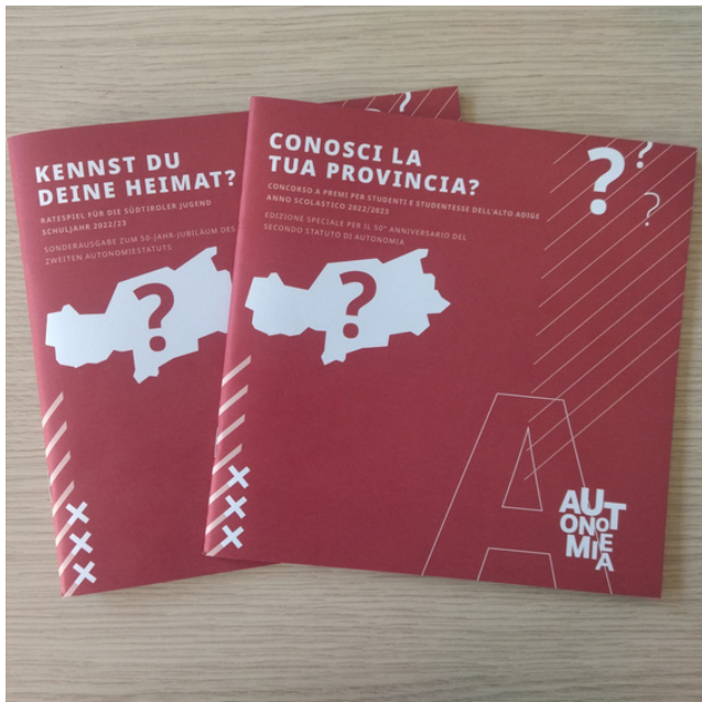
Kitêbokên almanî-italyanî ya di 50 saliya statuya otonomiya herêmê de hatine weşandin. /Autonomyexperience.org

Konseya wekî parlamentoya T.Başûr tevdigere û di çarçoveya xweseriyê de xwedî mafên qanûnçêkirinê ye. Konsey ji 35 wekîlên ku ji 5 salan carek li gorî kotaya etnîk tên hilbijartin, pêk tê. Endamên konseyê di heman demê de endamên Konseyê Trentîno-T.Başûr in.