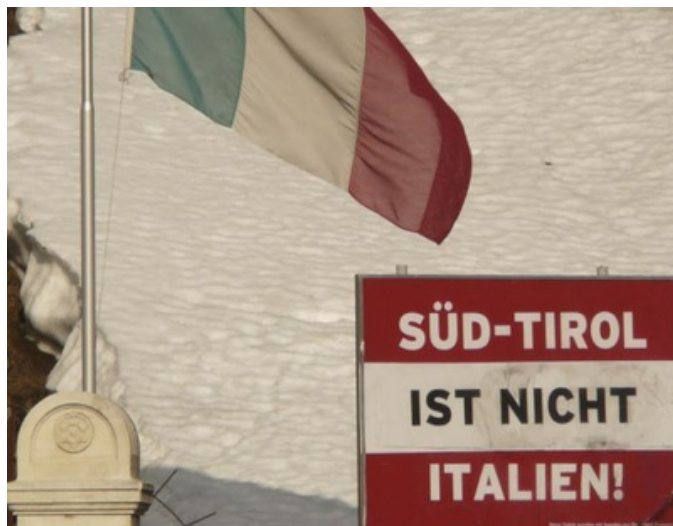
Tabelayek li Tîrolê: Tîrola Başûr ne Îtalya ye /Historiek.net

1969'an de bi alîkariya Neteweyên Yekbûyî di navbera Îtalya û Awusturyayê de peyman xweseriya Tîrola Başûr hat îmzekirin. Peymana xweseriyê ji 1972'an şûn ve gav bi gav hat meşandin û di 1992'an de her du devlet bi fermî dan zanîn, meseleya Tîrola Başûr hatiye çareserkirin.