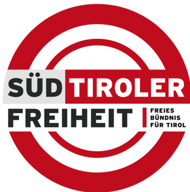
STF dixwaze Tîrola Başûr ji Îtalyayê veqete û tevî Awusturyayê bibe.

Bi van encamên hilbijartinê, çav li rêya li herêmê hukumetê koalîsyonê disa wê bê damezrandin.