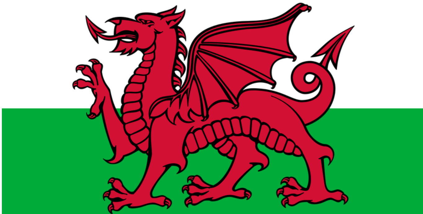
Ala Welatê Gal (Cymru)

Welatê Gal bi fermî "Wales" û miletê wê jî "Welsh" tê pênasekirin. Welatparêzên Galê daxwaz dikin, ji bo navê welêt peyva bi galî "Cymru" bê bikaranîn.