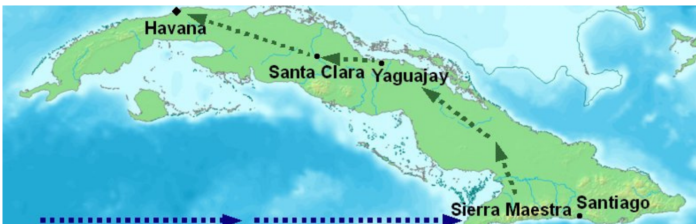
Hêzên şoreşger bi keştiya Granmayê gihîştin rojhilatê Kubayê. Paşê, di 1958'an de bi rotaya di ser Santa Clarayê re gerîla ket paytext Havanayê.

Digel ambargoya giran jî Kuba di warê avakirina binesaziya dewleta nû de serfiraz bû û bû yek ji dewleta herî bi îstikrar a Amerîkaya Latîn.