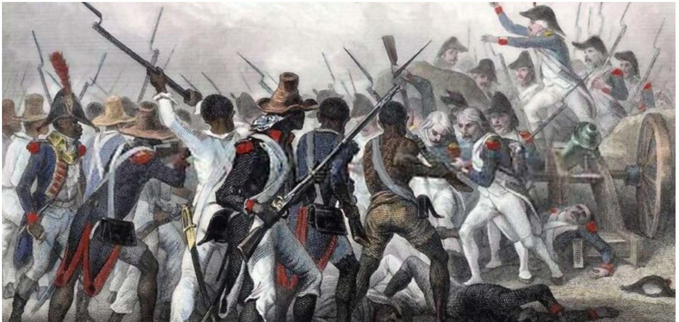
Rizgarkirina Crête-à-Pierrot (24ê adarê 1802) /Wêne: Auguste Raffet

Haiti li cîhanê welatê yekemîn e ku di encama têkoşîna koleyan de hatiye damezrandin. Di 1ê kanûna paşîn 1804'an de serxwebûna Komara Haitiyê hat ragihandin.